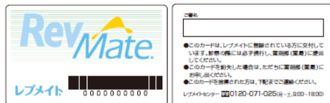
(患者登録カード：レブメイトカード)