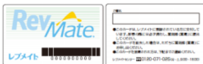
（患者登録カード：レブメイトカード）